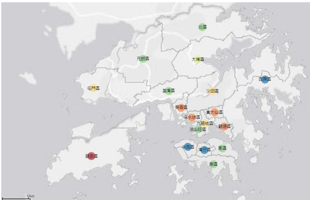
圖 2：社區健康資訊系統網上截圖 2，網址： http://www.pori.hk/cicd-mask-reserve-map